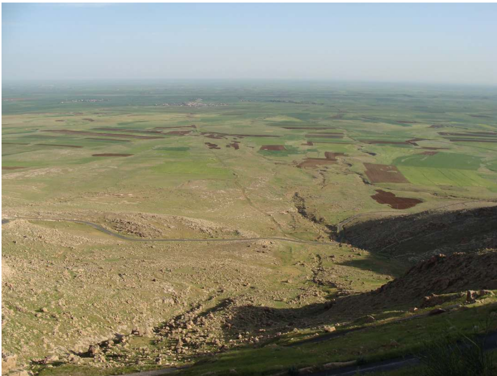
La plaine de Nusaybin, vue depuis le monastère syriaque de Mar Avgin S. Cavallès