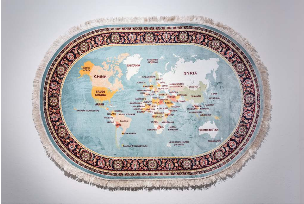
Şener Özmen, Heterotopia/Yok Ülke, 2015, tapis de soie, 225x160 cm