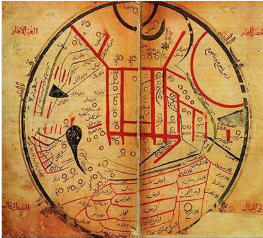
Fig. 3. Le monde turk selon Mahmoud de Kachgar.

Bibliothèque nationale, Manuscrits (Istanbul) 26 .