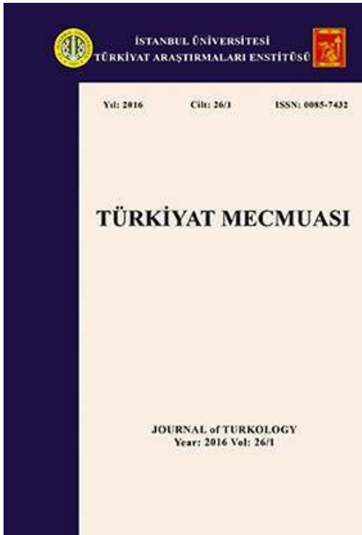
Fig. 6. Couvertures d'exemplaires des revues Yeni Türkiye (2002) et Türkiyat Mecmuası (1925 et 2016).