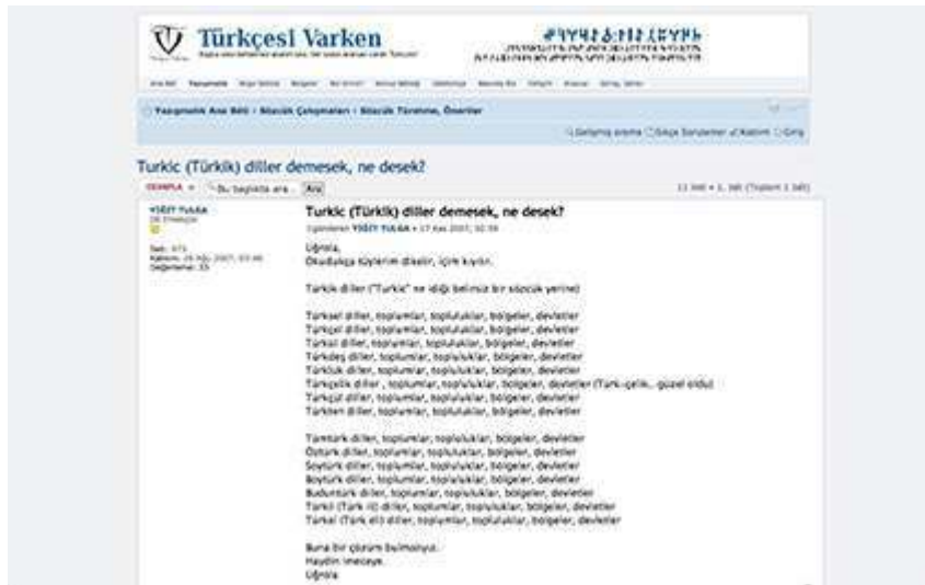
Fig. 2. Post publié sur le forum Türkçesi Varken , le 29 août 2007.