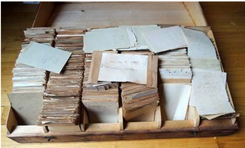
Fig. 4. « Mon index du Kachgarî. En caractères arabes ».